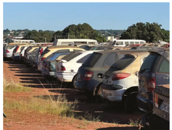
Serão leiloados vários veículos recuperáveis e ainda sucatas aproveitáveis

Quem desejar adquirir veículo nos leilões do Detran-GO deve buscar informação sempre no site oficial, canal pelo qual são divulgadas todas as ações e os procedimentos da autarquia.