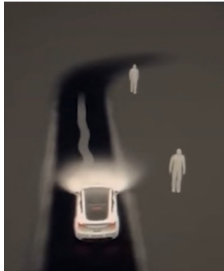
Imagem mostra tela do Tesla capturando imagens de ‘gente’ lá fora, mas na cena real ninguém está próximo

Fato ou ficção, relatos tornaram-se comuns no Tik Tok. Sensor anticollisão do carro aponta presença de ‘fantasmas’