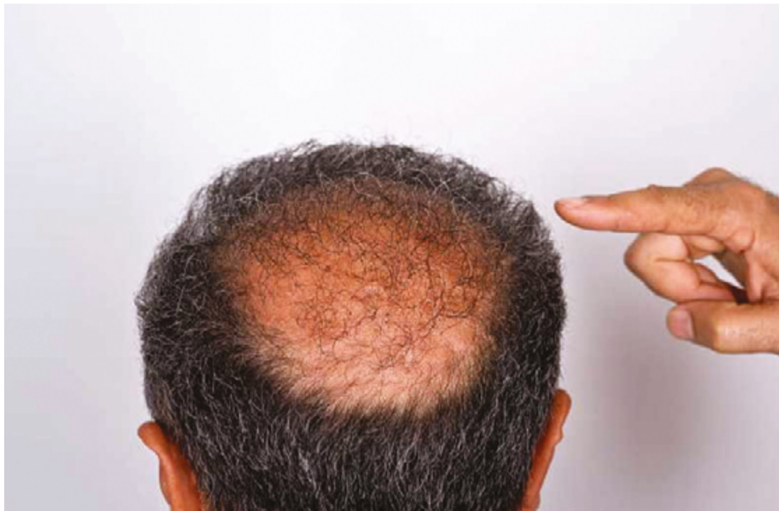
Com a modernização do serviço, mais pessoas passaram a procurar o tratamento; transplantes aumentaram 250%

“O transplante capilar é uma técnica que existe há muito tempo, começou há mais de 100 anos, lógico, com uma técnica rudimentar que era usada mais em sobrancelhas, em casos de hanseníase. Foi se desenvolvendo, mas até pouco tempo tínhamos um estigma da técnica antiga, aquela questão da cicatriz grande que ficava, veio uma técnica nova, que tirou essa cicatriz, tirou esse estigma e começou uma popularização”,