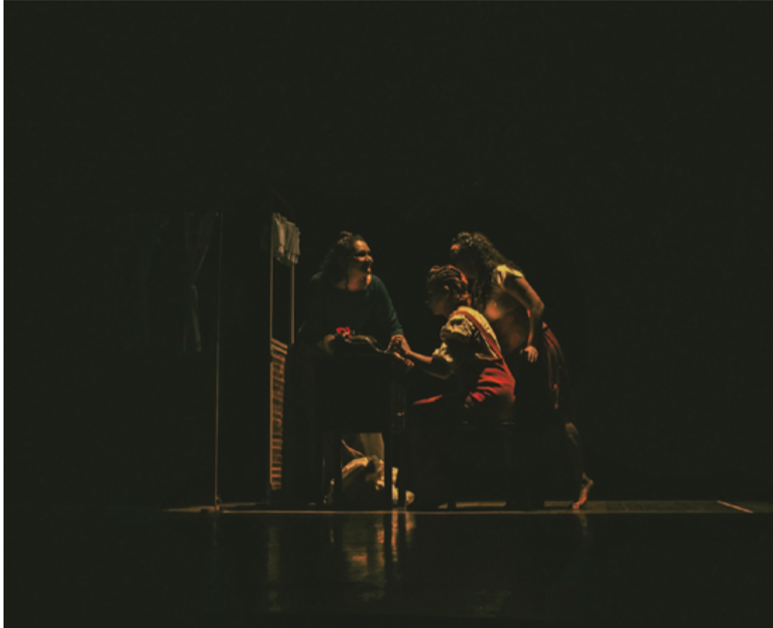
Programação tem início previsto para as 19h, no Teatro Municipal, e a entrada é totalmente gratuita