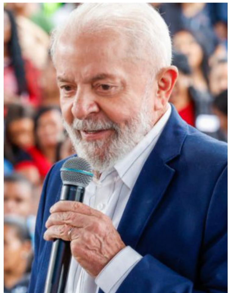
Lula da Silva: dificuldades em reduzir gastos públicos

"Começamos aqui a discutir 2025, a agenda de gastos. O que a gente pediu foi uma intensificação dos trabalhos", afirmou Haddad há pouco mais de três semanas. "Nós temos um dever de casa agora sobre o lado das despesas."