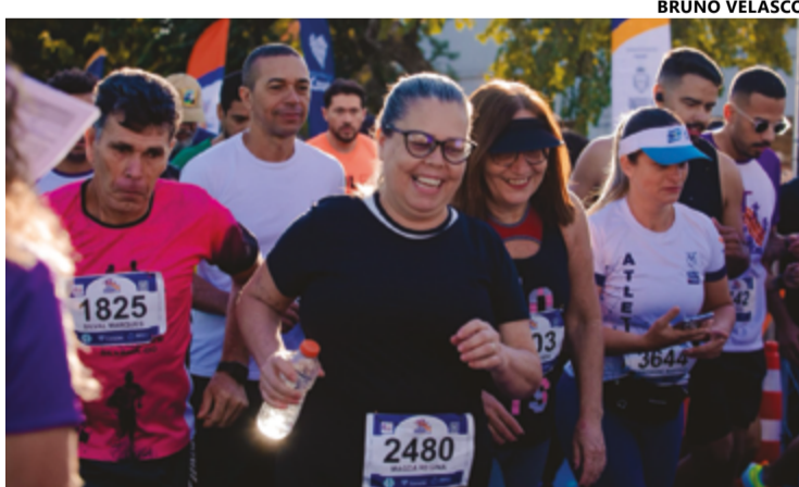
Corrida promoveu saúde, responsabilidade de combater abusos contra idosos

Como é tradicional nesta prova, 5 mil atletas participaram da etapa do circuito, dos quais 2.390 mulheres e 2.610 homens. Todos entraram no clima e ajudaram a promover a saúde e a solidariedade. Mais de seis toneladas de alimentos não perecíveis foram arrecadadas junto aos participantes,